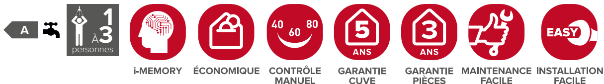
TABLEAU DE COMMANDE MANUEL